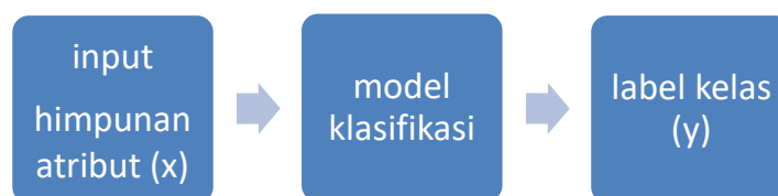
Gambar 2.1 Klasifikasi sebagai pemetaan input himpunan atribut x ke dalam kelas label y (Khomseh, 2016)

Klasifikasi adalah proses pembelajaran fungsi target f yang memetakan setiap sekumpulan himpunan atribut x ke dalam kelas label y yang belum diketahui sebelumnya seperti yang diilustrasikan Gambar 3.2.