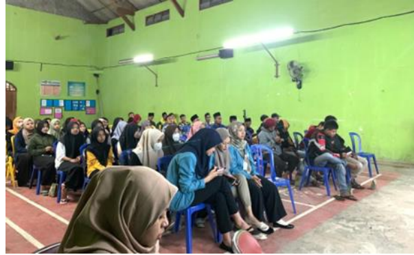
Gambar 1. Kegiatan penyuluhan kesehatan

Kedua, setelah materi selesai disampaikan, dilanjutkan evaluasi ( post-test ) dengan memberikan soal yang sama saat pre-test . Untuk memberikan apresiasi kepada peserta yang mendapatkan skor tinggi diberikan doorprize . Tabel 1 menunjukkan hasil pre-test bahwa rata-rata pemahaman peserta mengenai persiapan pranikah sebesar 90,00 dan nilai post-test sebesar 95,41. Hal ini menunjukkan adanya peningkatan sebesar 5,41 poin. Hasil ini juga sejalan dengan kegiatan yang dilakukan oleh Rahmanindar et al. (2021) bahwa kegiatan penyuluhan dapat meningkatkan pengetahuan persiapan pranikah pada remaja. Selain itu, pada kegiatan penyuluhan ini juga menggunakan media visual yang mana dapat membantu peserta bisa tetap melihat dan memperhatikan setiap materi. Hal ini juga sejalan dengan Purwanti et al. (2020) bahwa media power point masih relevan, mudah untuk memahami materi dan meningkatkan semangat karena memiliki template yang dapat disesuaikan dengan tema materi.