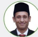
Nadiem Anwar Makarim, B.A., M.B.A.* (Menteri Pendidikan)