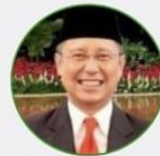
Budi Gunadi Sadikin (Menteri Kesehatan)