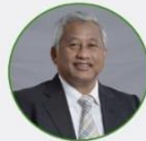
Prof Dr Ir H. Moh. Nuh DEA (Syuriyah/PBNU/Ketua YARISIS)