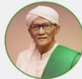
KH. Miftahul Akhyar (Rais Am PBNU)