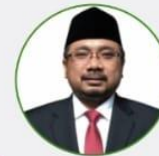
H. Yaqu Cholli Qoumas (Menteri Agama)