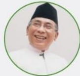
Dr. (HC) KH Yahya C Stakuf (Ketua Umum PBNU)