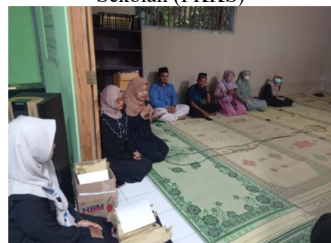
Pendampingan lomba BTQ