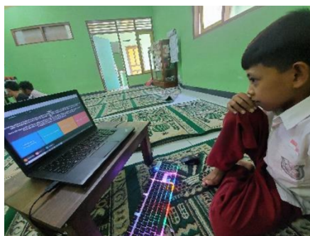
Adaptasi teknologi dengan quizzi