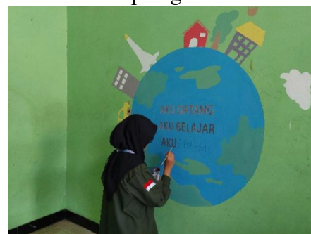
Pembuatan pojok baca