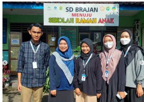
Supervisi DPL ke sekolah