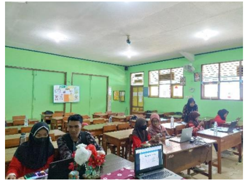
Pre test AKM Kelas