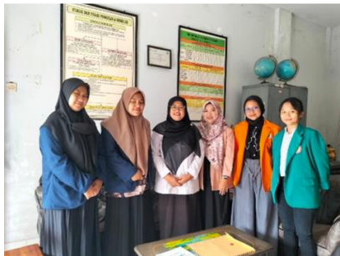
Penerjunan SD 2 Patalan