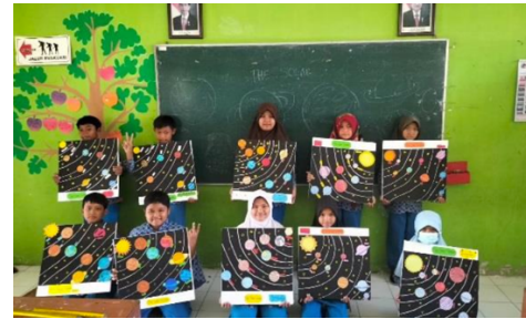
Membuat media pembelajaran tentang tata surya