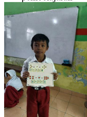
Pembelajaran numerasi dengan alat peraga