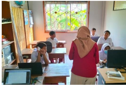
Pelaksanaan AKM Kelas