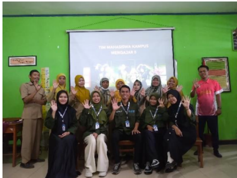
Forum Koordinasi dan Komunikasi Sekolah (FKKS)