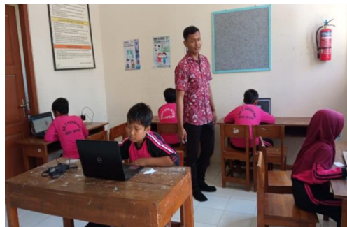
Adaptasi teknologi dengan pengenalan microsoft word