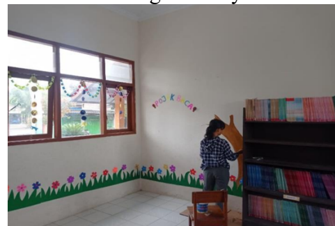
Membuat pojok baca di setiap kelas