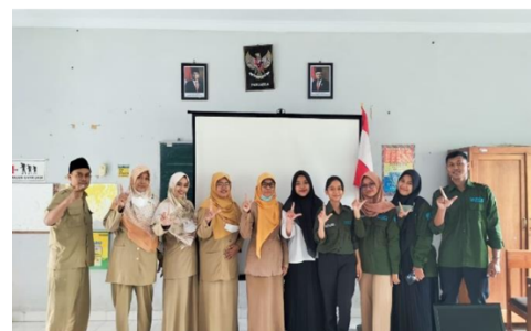
Forum Koordinasi dan Komunikasi Sekolah (FKKS)