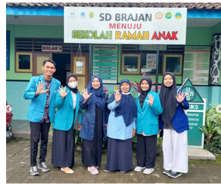
Penerjunan SD Brajan