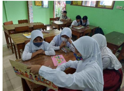
Pembiasaan membaca 15 menit sebelum pembelajaran