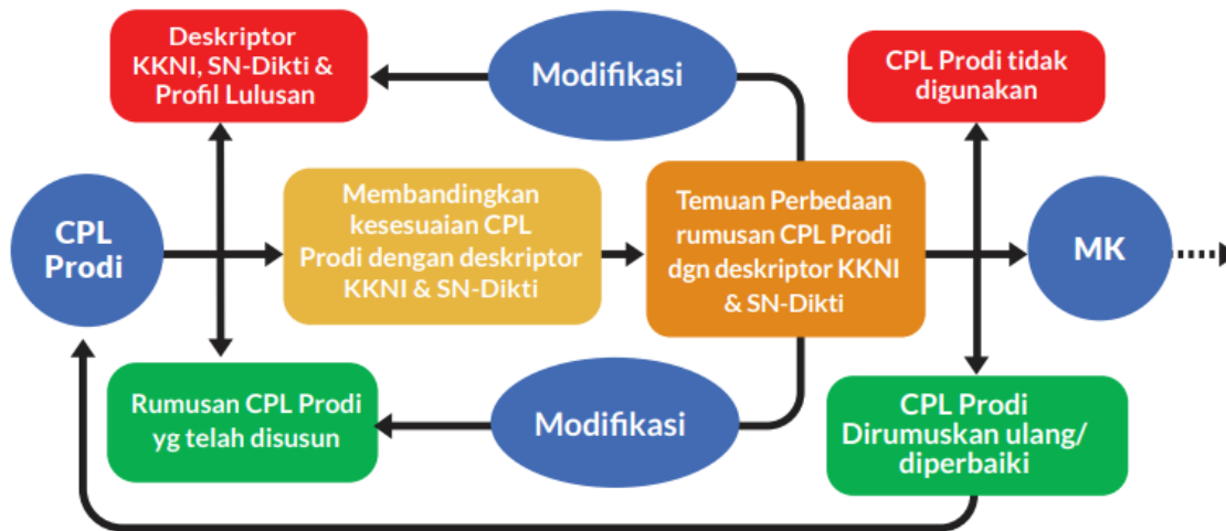
Gambar 1. Contoh Mekanisme Evaluasi CPL Prodi