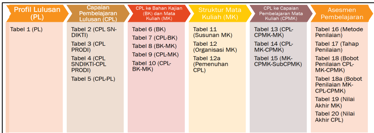
Gambar 3. Model Kurikulum berbasis OBE

Proses penyusunan Panduan Kurikulum Berbasis OBE untuk Sistem Informasi pada buku ini menggunakan model pada Gambar 3 Model Kurikulum berbasis OBE, yang terdiri dari beberapa tahap. Tahap pertama merupakan pendefinisian Profil Lulusan (PL). Pada tahap kedua, dilakukan pendefinisian Capaian Pembelajaran Lulusan (CPL) yang merupakan daftar kompetensi yang dituju oleh Program Studi sesuai Profil Lulusan (PL). Selanjutnya, pada tahap ketiga, dilakukan identifikasi dan pemetaan Bahan Kajian (BK) dan Mata Kuliah (MK) yang dapat mendukung pencapaian pembelajaran (CPL). Mata Kuliah (MK) tersebut lalu disusun ke struktur mata kuliah sesuai urutan semester di tahap keempat. Di tahap kelima, dilakukan identifikasi Capaian Pembelajaran Mata Kuliah (CPMK) untuk setiap Mata Kuliah (MK) dan pemetaannya terhadap Capaian Pembelajaran Lulusan (CPL). Terakhir, di tahap keenam, dilakukan pendefinisian metode, tahap, dan bobot penilaian untuk setiap CPMK dan pemetaannya terhadap nilai akhir MK dan CPL.