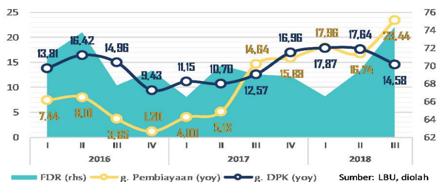
Gambar 1. 1 Perkembangan Pembiayaan, DPK dan FDR Bank Syariah

Selain itu, indikator rasio keuangan juga membaik seperti BOPO, FDR, ROA, dan CAR. 9